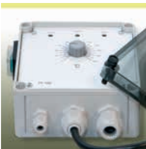
Elektronischer Temperaturregler HM-EC210

Zur Temperaturregelung empfehlen wir unser Programm an elektronischen Steuer- und Temperaturregelgeräten sowie die entsprechenden Temperaturfühler: