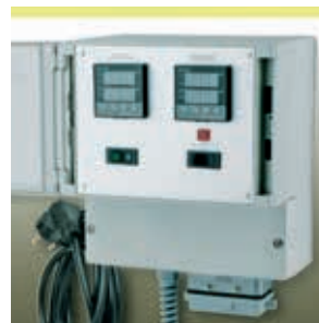
Elektr. Regler- Begrenzerkombination HM-RD3012