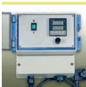
Elektronischer Temperaturregler Serie HM-RD1000