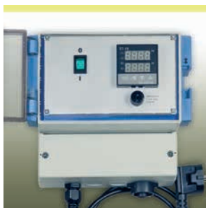
Elektronischer Temperaturregler HM-RD 1000