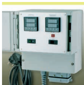
Elektr. Regler-Begrenzerkombination HM-RD 3000