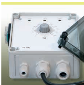
Elektronischer Temperaturregler HM-EC 210

Zur Temperaturregelung empfehlen wir unser Programm an elektronischen Steuer- und Temperaturregelgeräten sowie die entsprechenden Temperaturfühler.