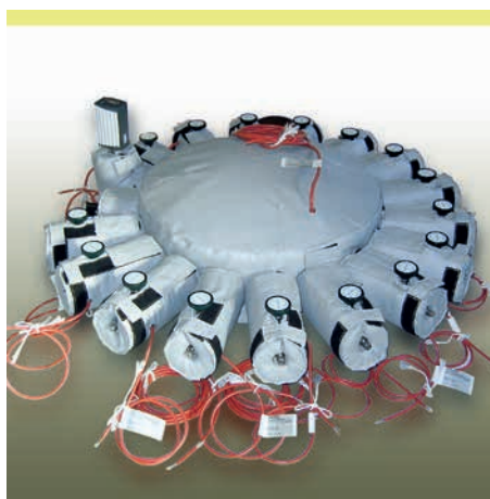
Beheizung für Kalibriersystem